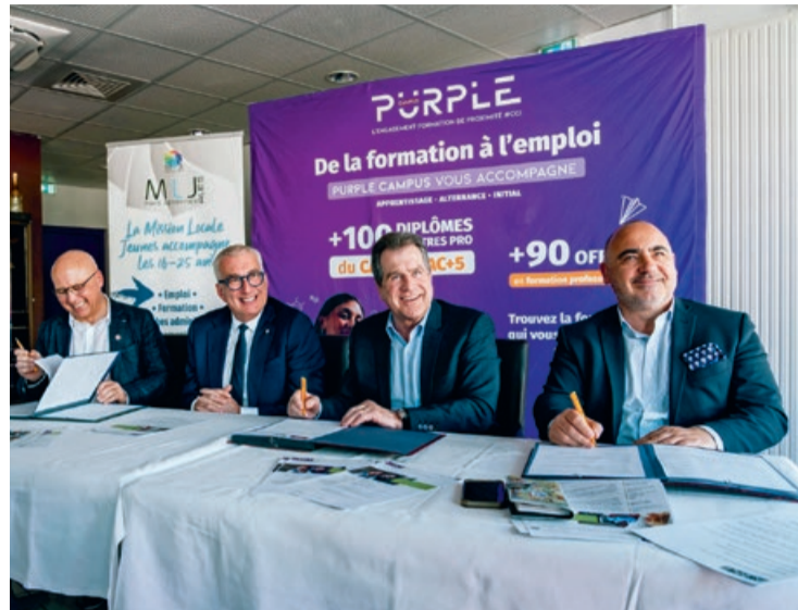
De préparateur en pharmacie à infirmier, ce sont autant de métiers en tension sur le bassin alsésien. La convention a été signée le 2 avril.

en pharmacie, aides-soignants, auxiliaires de puériculture, infirmiers : autant de métiers indispensables, mais dont les parcours d'accès restent exigeants et parfois dissuasifs.