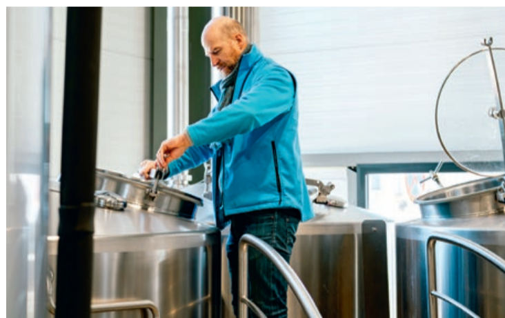
En 2025, Meduz a brassé 380 000 litres de bière et a réalisé 1,15 M€ de chiffre d'affaires.

Installée à Méjannes-lès-Alès, la brasserie artisanale, qui a reçu de nouvelles médailles pour ses bières, vise une production de 500 000 litres d'ici trois ans et lance une gamme sans alcool.