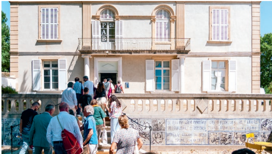
Au musée-bibliothèque Pierre André Benoit, vous pourrez découvrir la toute nouvelle exposition mettant en lumière Iliazd, figure centrale des avant-gardes du XX e siècle.

réaliser leurs propres créations, tout en découvrant les différentes céramiques du musée, notamment le vase d'Anduze.