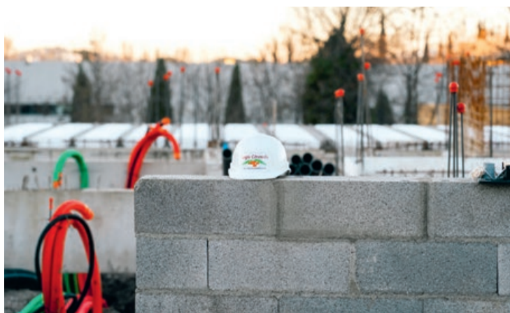
Chaque opération de construction neuve représente un travail administratif colossal pour le bailleur social alésien.

Tout part de l'expression des besoins par un territoire : de l'idée à la livraison, le bailleur social mène des projets sur plusieurs années. Entre contraintes réglementaires, techniques et échanges avec les acteurs, chaque logement neuf exige un long travail.