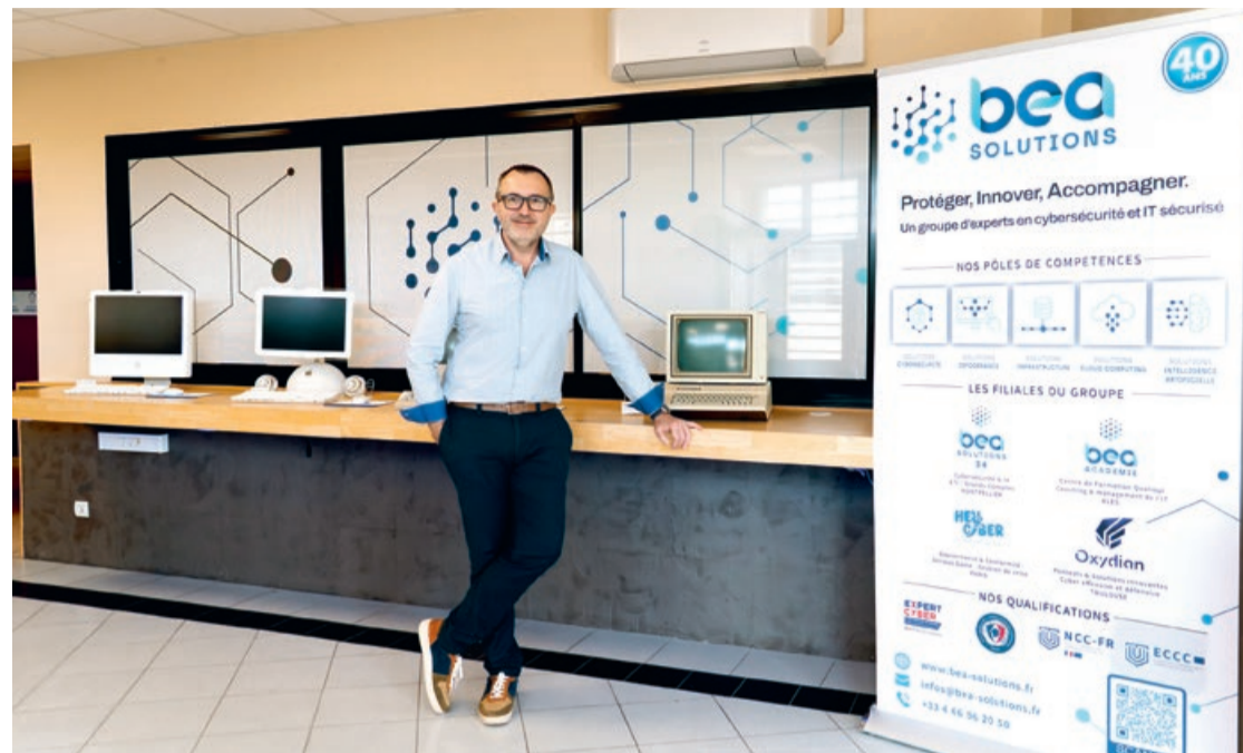
BEA Solutions a créé BEA Académie, son propre centre de formation à Alès.

4 M€ DE CHIFFRE D'AFFAIRES ET 40 SALARIÉS