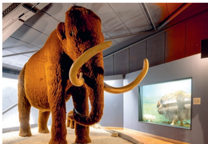
Le mammoth, véritable emblème du site, est l'une des pièces maîtresses de l'imposante collection présentée dans les galeries.