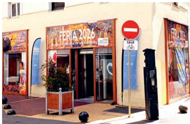
La boutique FERIA sera ouverte jusqu'au 17 mai avant de laisser place à une autre boutique et à un point d'information touristique de la Ville d'Alès.

Dans la continuité des États Généraux du Cœur de Ville organisés en 2016 et dans le cadre du programme national Action Cœur de Ville, une autre boutique éphémère est attendue d'ici quelques semaines, à proximité des Halles de l'Abbaye