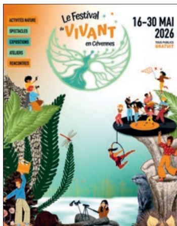
Un festival gratuit, participatif et itinérant pour faire dialoguer le vivant, les arts et les habitants.

Deux semaines placées sous le signe de l'émerveillement et de la célébration du vivant. Le Parc National des Cévennes, le CPIE du Gard, les Écologistes de L'Euzière et le Syndicat des Hautes Vallées Cévenoles (SHVC) s'associent afin de proposer une 2 e édition haute en couleur du Festival du Vivant. Pendant 15 jours, il investira plus de 20 communes du territoire en proposant des formats variés, gratuits et grand public qui permettront de découvrir la biodiversité, de se rencontrer et de partager. « Nous