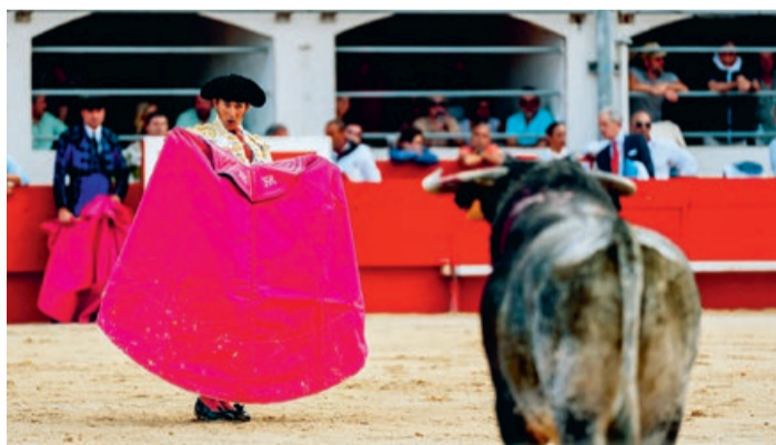
Novillada à 11 h et Grande Corrida à 17 h : une programmation spéciale, mais pensée pour valoriser pleinement chacun des spectacles.