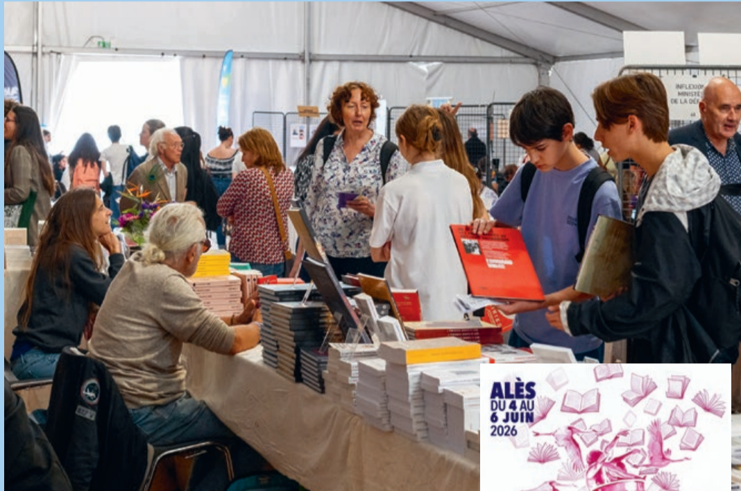
Le salon du livre sera accessible dès le 4 juin et accueillera une centaine d'auteurs qui présenteront leurs ouvrages.

En raison des travaux en cours Eau Cratère, le grand Salon du livre s'installera cette année le long de l'avenue Carnot, sur le parking supérieur du Gardon, face au square Arnaud-Beltrame. Comme pour chaque édition, le salon sera le véritable poumon du festival, regroupant une centaine d'auteurs et autant de maisons d'édition. Petits et grands y retrouveront ainsi des maisons locales, comme la nîmoise Alcide qui est mise à l'honneur cette année, ou encore Au Diable Vauvert ; mais aussi de très belles maisons nationales comme Tallandier, La Découverte, Le Seuil ou encore les Presses de la Cité. « Nous compterons également parmi nous des maisons internationales », se félicite Franck Belloir, directeur