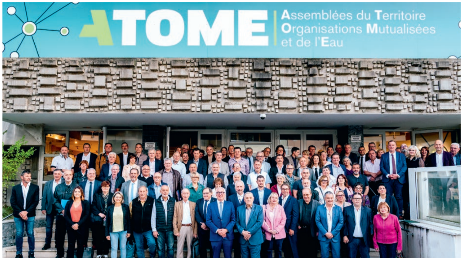
Les 112 élus communautaires ont installé la nouvelle Assemblée le 9 avril.

Dans la foulée, les élus ont désigné les 15 vice-présidents (lire ci-contre) qui seront en charge de compétences spécifiques, ainsi que les 60 membres du bureau communautaire. Cette nouvelle équipe aura la charge de piloter les grands dossiers du territoire, dont l'Agglo a la compétence, pour les six prochaines années ; qu'il s'agisse des transports, de la gestion de l'eau et des déchets ou encore du développement économique. Loin d'être anecdotique, cette élection marque le début d'un nouveau mandat pour l'agglomération alésienne. Dans un contexte de