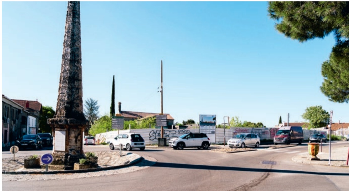
Située juste en face de l'Obélisque, la résidence sera habillée par un petit espace vert créé par la municipalité.