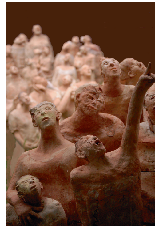
Carte Blanche - Eric HENGL

Vase d'Anduze : espace dédié aux entreprises locales qui perpétuent aujourd'hui cette tradition mondialement reconnue.