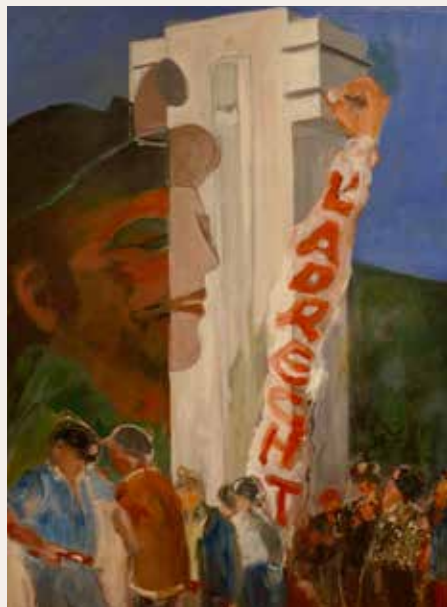
© Musée du Colombier - Pierre Chapon