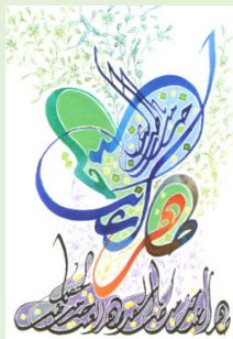
Calligraphie arabe de Salah Al Moussawy

Entrée gratuite au musée et à toutes les expositions.