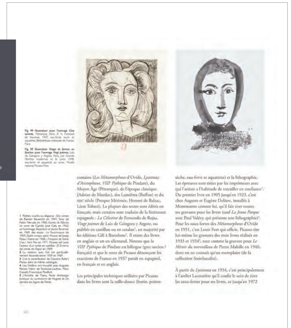
Fig. 49 Illustration pour l'ouvrage Cinq sonnets , Pétrarque, Paris, A la Fontaine (C. Yverton, 1947), eau-forte, laque et aquatinte, Bibliothèque nationale de France, Paris.