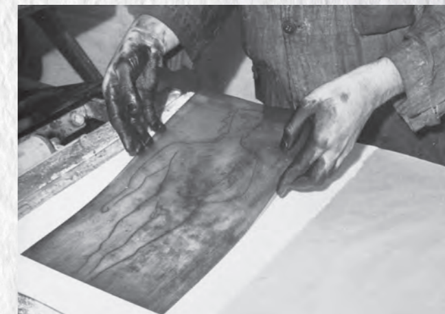
PAB tirant une gravure pour VIII e Pythique de Pindare