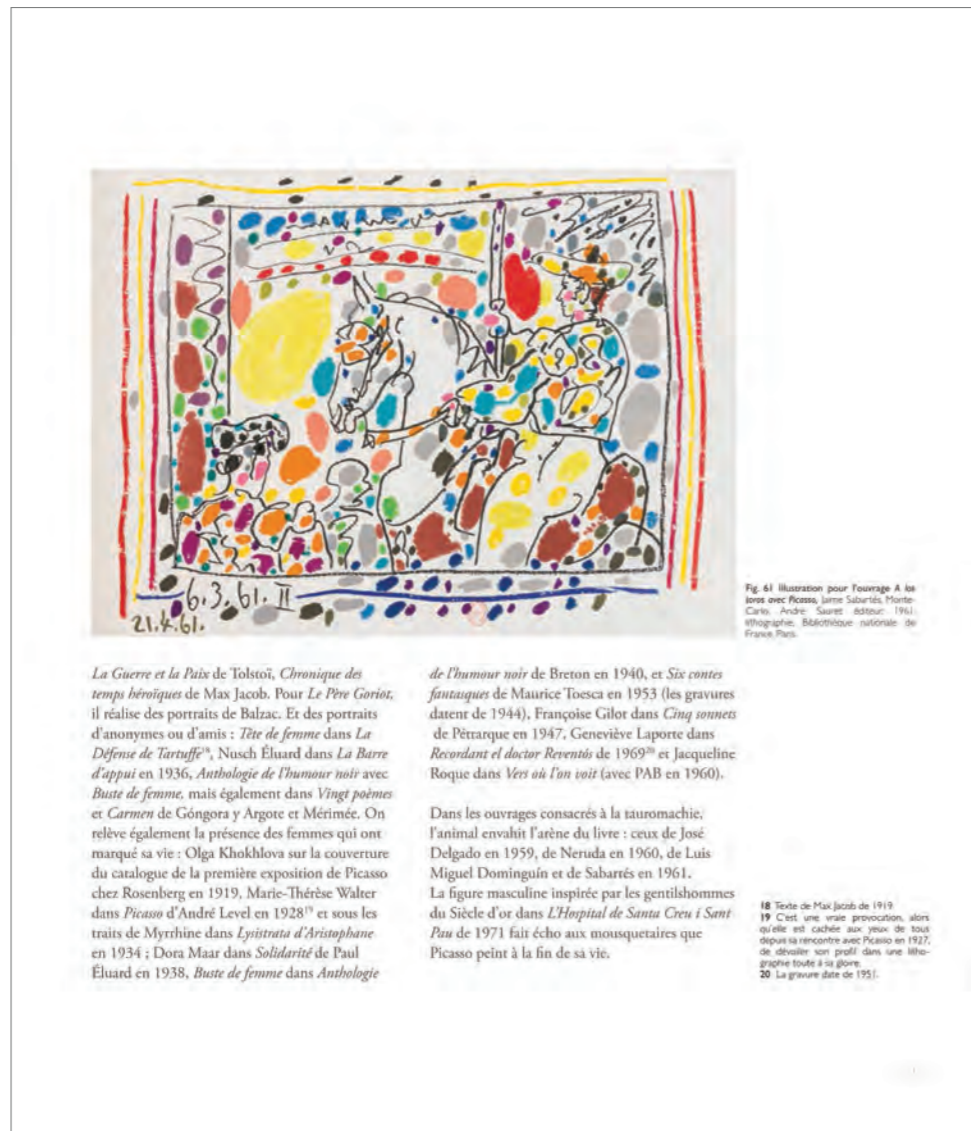
Fig. 61 Illustration pour l'ouvrage A los toros avec Picasso, Jaime Sabartés, Monte-Carlo, André Sauret éditeur, 1961, lithographie, Bibliothèque nationale de France, Paris.

Picasso et le livre d'artiste chez Bernard Chauveau Edition, 24x28cm, dos carré cousu collé, 92 pages, 75 illustrations - 24€TTC