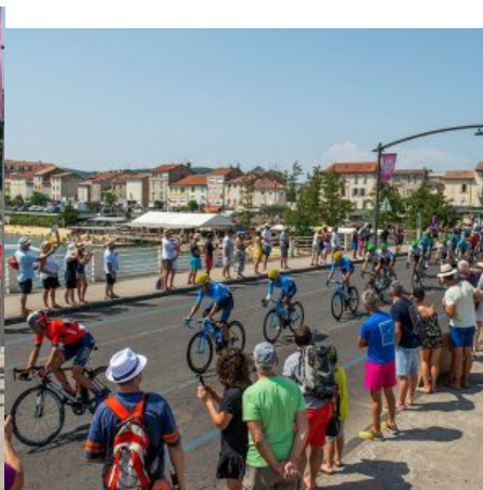
Traversée du Pont Neuf à Alès par le peloton.