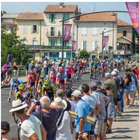
Le public était présent au rendez-vous pour encourager les coureurs.