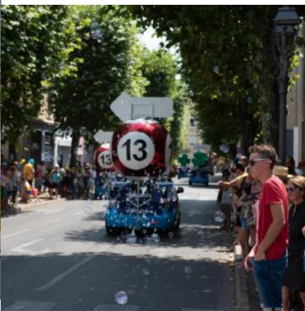
Un large public était présent pour le passage du Tour de France et de sa célèbre Caravane.