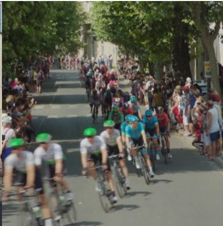
Les coureurs ont traversé une partie de la ville d'Alès avant de poursuivre le parcours sur les routes de l'Agglomération.