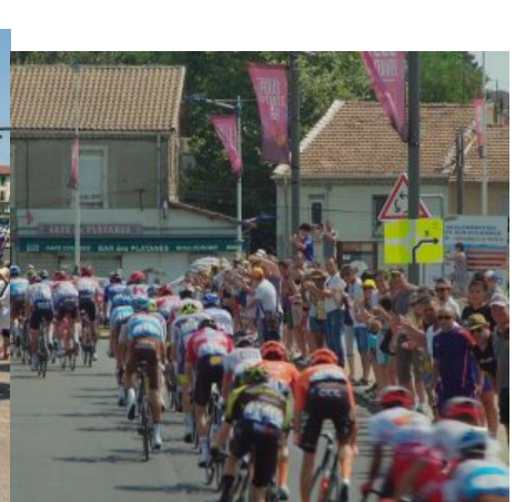
Le peloton salué et encouragé par la foule.