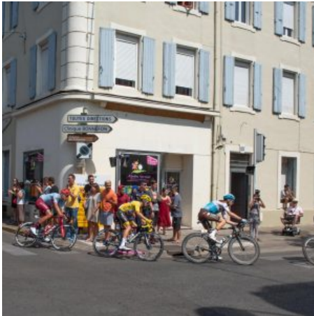
Les coureurs et le maillot jaune ont traversé Alès sous un soleil écrasant.