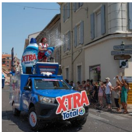
La Caravane du Tour a précédé l'arrivée des coureurs.

Au final de cette étape surchauffée, c'est l'Australien Caleb Ewan qui a réglé le sprint du peloton à Nîmes, le Français Julian Alaphilippe gardant le Maillot Jaune.