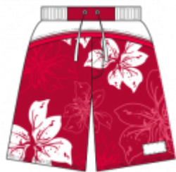
Short de bain