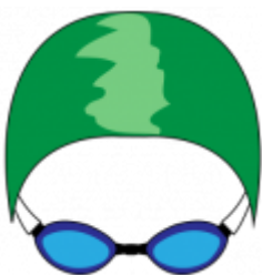
Bonnet de bain