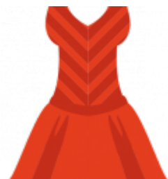
Maillot de bain robe